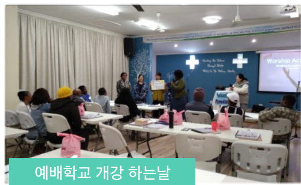
예배학교 개강 하는날