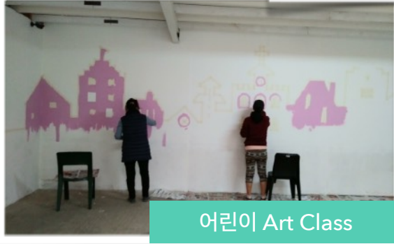
어린이 Art Class