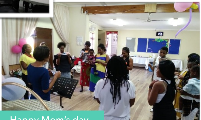
Happy Mom's day